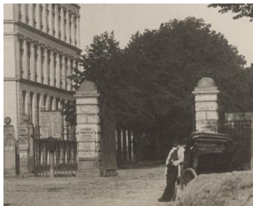
Her ses jernporten med opslag om trafik- og adfærdregler på et af de ældste fotografier fra København.

Navnet Vesterbro - eller oprindeligt Vester Broe - stammer fra 1616, da gaden blev brolagt indtil den nuværende Værnedamsvej. Det var under Christian IV at der gennem en ådal med sumpede områder og adskillige små vandløb blev ført en vej igennem mod vest fra den Vestre Port i den kgl. residensstad. Efter nogle år blev brolægningen forlænget frem til Platanvej ved Sorte Hest 4 med det berømte/berygtede gæstgiveri Den Gyldne Løve.