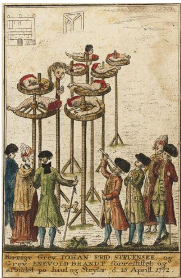
<- Et samtidigt stik med teksten: Forrige Grev JOHAN FRID. STRUENSEE, og Grev ENEVOLD BRANDT, forrestillet og afbildet po hiul og Stejler d. 28 April 1772

På Vestre Fælled lå desuden en galgebakke, og det var her, at de parterede lig af kongens livlæge Johann Friedrich Struensee og hans allierede Enevold Brandt i april 1772 blev stillet på hjul og stejle, omtrent hvor VEGA nu ligger, til skræk, advarsel og tilfredsstillelse for forbipasserende. Henrettelserne var foregået på Østre Fælled ved nuværende Trianglen, men af hensyn til 'Folkerørelsen' blev parteringen og opsætningen henlagt til Vestre Fælled.